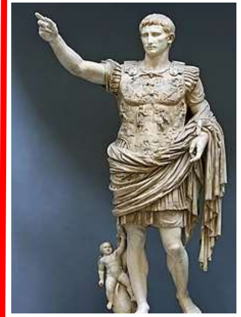
Statue officielle d'Octave Auguste, premier empereur de Rome

Elles permettent d'octroyer la citoyenneté romaine